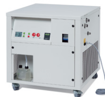
Inert Loop B-295 有机溶剂喷雾干燥