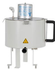
Spray Chilling 在冷却柱中加热样品和喷雾